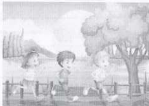
Составление режима дня и оценка двигательной активности детей

Совместная работа родителей с детьми по составлению режима дня и меню позволит получить новые навыки, а также существенно сократить риски здоровью, обусловленные нерациональным режимом дня и нездоровым питанием.